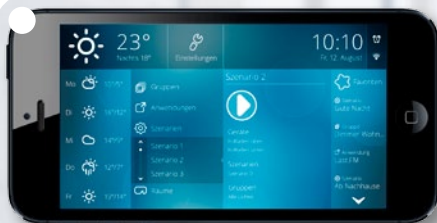
Die Bedienoberfläche des B-TRONIC-Systems mit Statusanzeige